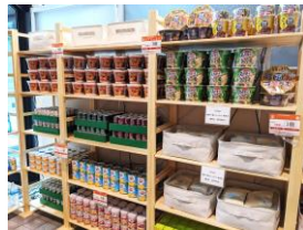
街かどフードパントリー