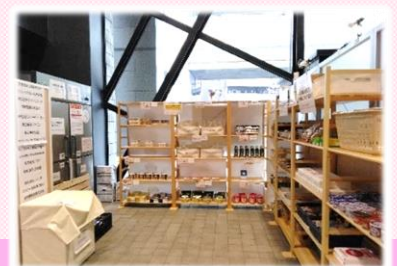
街かどフードパントリー