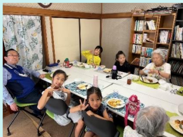
カフェひびき (誰でも食堂)