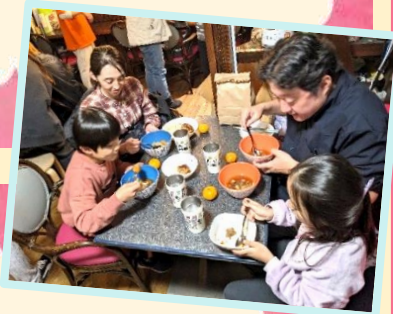
地域のみなば食堂