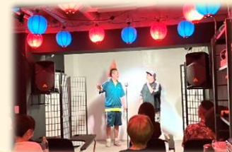
スーパー弾力素材