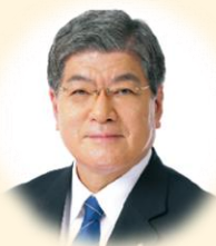
板橋区長 坂本 健